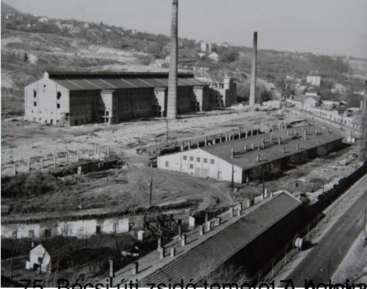
75. Bécsi úti zsidó temető A Hozsán utca szépi lakása, 1940-43, ékecske, 1947. június 20. 7. sz., 8